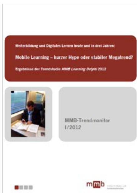
Titelseite der Trendstudie MMB Learning Delphi 2012

wählt? Wie sind sie genau vorgegangen? Vor allem: War der Einsatz erfolgreich? Um dieses Bedürfnis nach Praxisinformationen zu befriedigen, haben sich Teams aus vier Universitätsinstituten in Deutschland, Österreich und der Schweiz zusammengeschlossen und das Enterprise 2.0-Fallstudienetzwerk gestartet. Inzwischen sind auf der Plattform „e20cases.org“ fast 100 Fallstudien dokumentiert. Sie sind zum einen nach verschiedenen Qualitätsstufen geordnet (Orange, Gold, Silber, Bronze). Zum anderen sind sie verschiedenen Kategorien zugeteilt, damit Nutzer schnell die „richtigen“ Fallstudien finden. So sind derzeit zum Beispiel 53 Fallstudien dem Einsatzfeld „Wissensmanagement“ und fünf dem Einsatzfeld „Lernen und Training“ zugeordnet. ◀