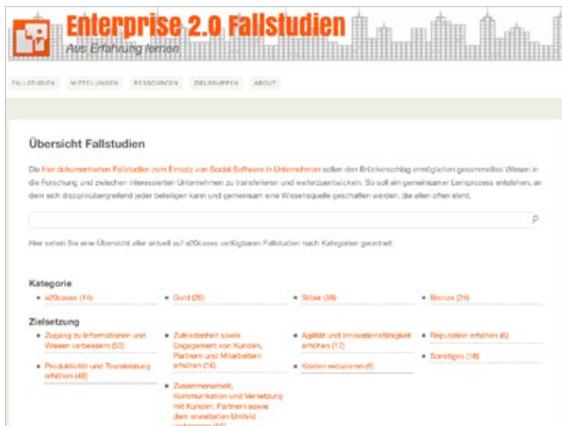
Enterprise 2.0-Fallstudienetzwerk, http://www.e20cases.org