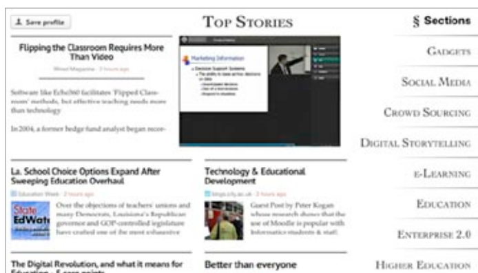
Zite, „Personalized Magazine for iPad and iPhone“

ren“ aufgeteilt. „Renner“ der Community ist übrigens das Prüfungsvorbereitungswiki, mit dem sich die Auszubildenden für die zweimal jährlich bundesweit stattfindenden Prüfungen fit machen.